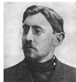
Яков Исидорович Перельман

Вопрос 3. Какой русский ученый боролся за внедрение в России метрической системы, и его дело увенчалось успехом?