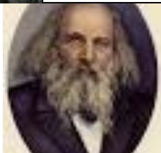
Дмитрий Иванович Менделеев