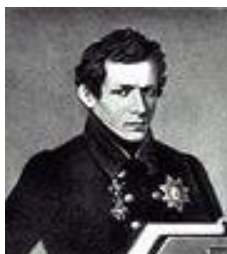
Николай Иванович Лобачевский

Вопрос 2. Соедините стрелочками портрет и фамилию имя отчество ученого